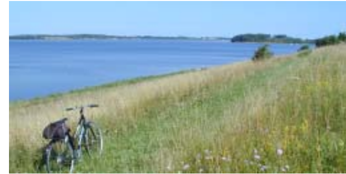
Overdrev ved Vellerup Sommerby