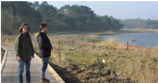
Træbro ved Sømer Skov

Isefjord var i gamle dage et vigtigt fangststed for marsvin. Selvom antallet af marsvin i dag er lavere, kan man stadig være heldig at se dem både i Isefjord og Roskilde Fjord. Hvis man er