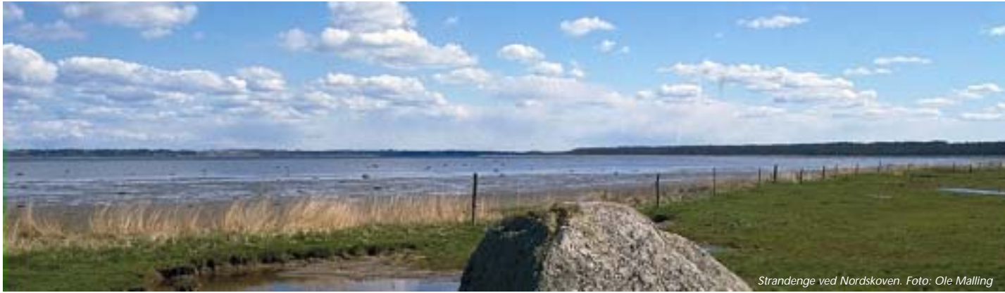
Strandenge ved Nordskoven.