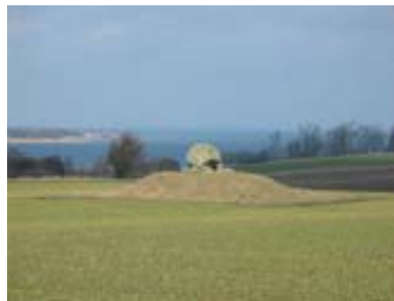
Gravhøj i Venslev bakker

Oven på mange af bakkerne ligger der gravhøje, og i området findes en af landets tætteste koncentrationer af gravhøje og jættestuer fra bondestenalder og bronzealder. Horns Herreds fjordlandskab af beskyttede øer, vige, strømsteder og gode fiskemuligheder og østersbanker blev udnyttet i oldtiden. De sandede jorde i Horns Herred var meget egnede for bronzealderens plov. Ved Venslev bakker har der formodentlig været overskud til et stortilet byggeri. Området med de mange